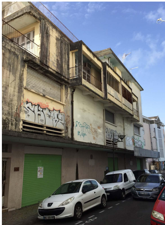
Parcelles AK1-2-3 Rue Schoelcher/Quai F. Lesseps Ville de Pointe-à-Pitre