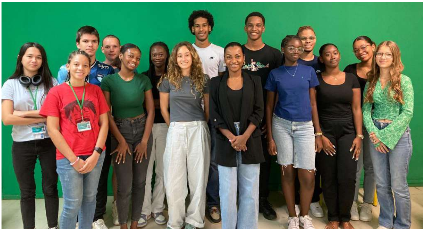
Les élèves de la 1ere option Cinéma-Audiovisuel du lycée Sonny Rupaire de Sainte Rose