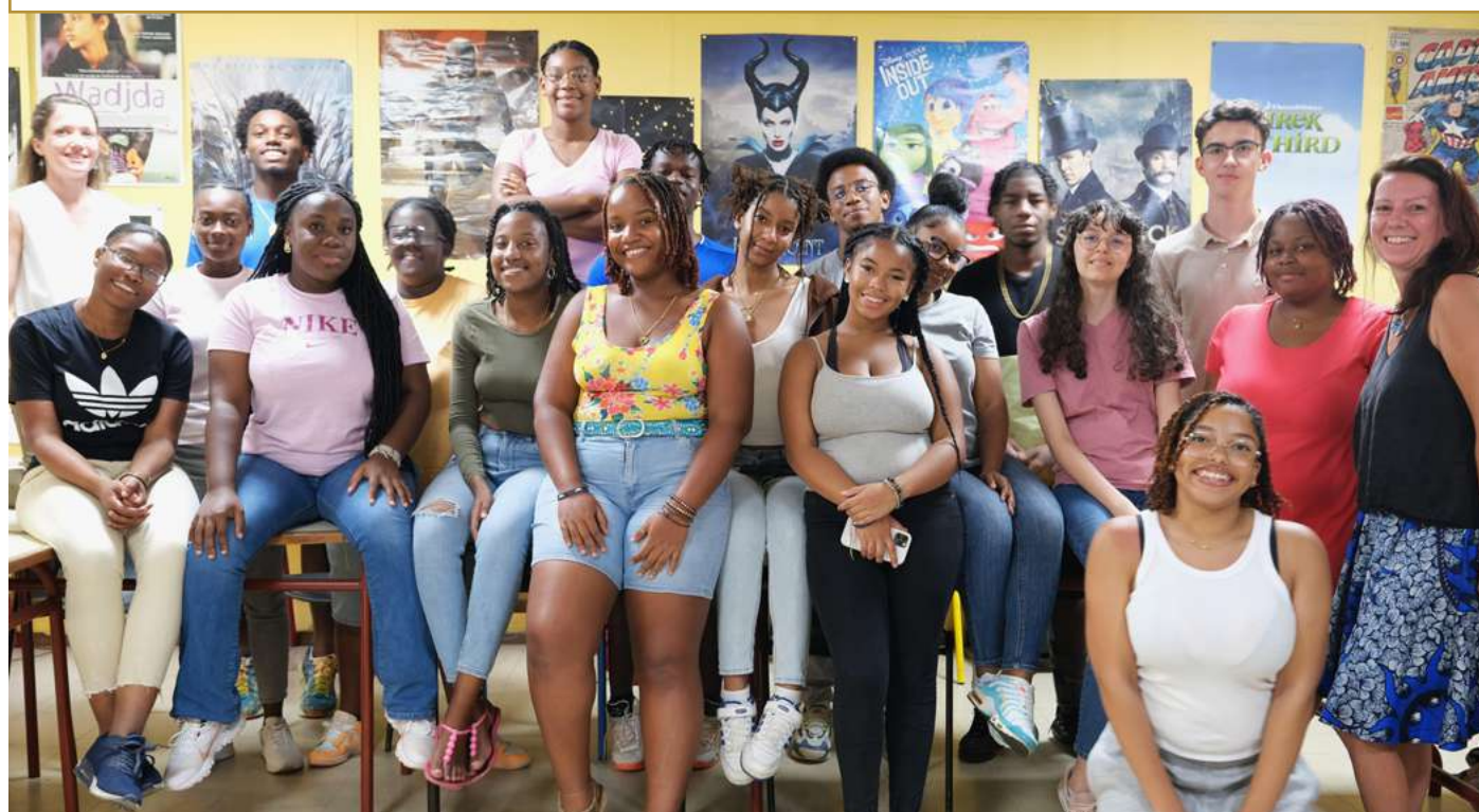
les élèves des 1ere et Terminale option Cinéma-Audiovisuel du lycée Félix Proto aux Abymes